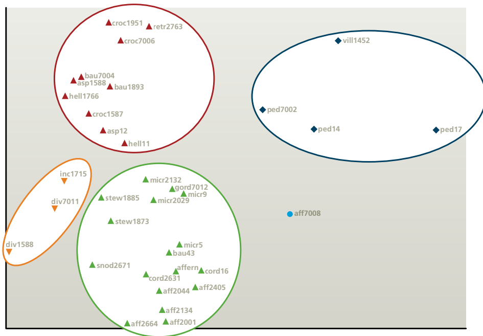
På baggrund af indholdsstofferne i de æteriske olier fra de 15 arter af Scalesia er de indsamlede prøver sat op i et ordinationsdiagram. Lille afstand mellem punkterne i diagrammet er et udtryk for, at indholdet i de æteriske olier ligner hinanden meget. De ovale figurer viser, hvordan prøverne ved en anden metode, clusteranalyse, falder ud i 4 naturlige grupper. Den formodede stamform – Scalesia affinis (aff) – findes nederst i den grønne cirkel.