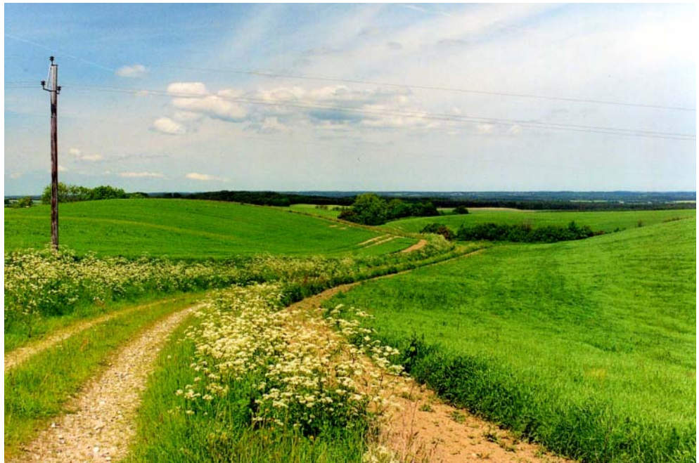
Figur 1: Natur defineres og opleves meget forskelligt afhængigt af personlig, social og kulturel baggrund.

Indikatorernes relevans er imidlertid afhængig af, hvordan man definerer naturkvalitet, og hvilke mål man tilstræber. Enighed om indikatorer forudsætter derfor enighed om definitionen på naturkvalitet. Forudsætningen for forståelsen af, hvilken type naturkvalitet man ønsker at opnå, er, at de parter, der har en interesse i naturkvalitet, er i stand til at kommunikere og udveksle deres forskellige forestillinger og forventninger i et sprog, der er tilgængeligt for alle parter i sagen. Kommunikation er således middel til bevidstgørelse om egne standpunkter og til etablering af en fælles målforståelse (Højring et al. 2004b).