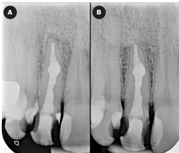
Fig. 4. Postoperativt billede af behandling af 2+ (A). Syv måneders kontrolbillede af 2+ med gendannet lamina dura apikalt (B).