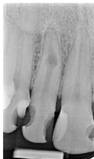
Fig. 1. Præoperativt billede af 2+ med intern resorption i nederste apikale 1/3. Bemærk, der ses apikal øget radiodensitet.