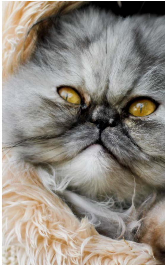
PERSERKAT. Katte af denne race er fremavlet med meget flade ansigter. Dette giver anledning til en række velfærdsproblemer – ikke mindst i form af besværet vejtrækning. Ifølge en spørgeskemaundersøgelse fra 2012 angav 87 % af de praktiserende dyrlæger, der havde perserkatte og andre katte med flade ansigter som patienter, at de havde kendskab til vejtrækningsproblemer hos disse katte, og 25 % angav, at forsnævrede næsebor og vejtrækningsproblemer var hyppigt forekommende.