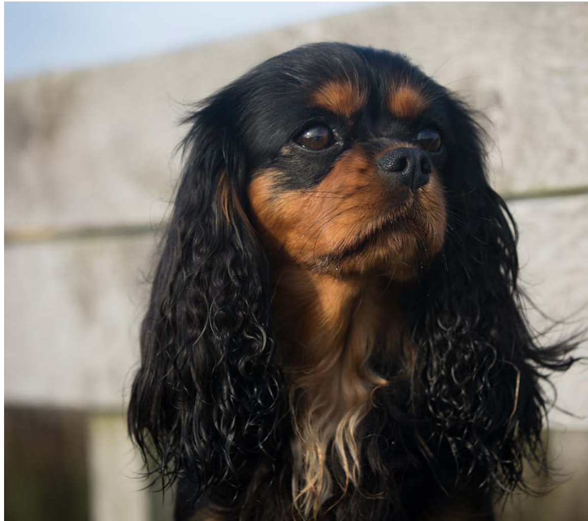
CAVALIER KING CHARLES SPANIEL. Hunde af denne race er fremavlet med et meget fladt hoved. Som sandsynlig konsekvens heraf kan hundene blive ramt af den smertefulde lidelse syringomyeli. Endvidere har indavl hos denne race medført andre arvelige lidelser. Ifølge data fra det svenske forsikringselskab Agria har hunde af denne race således ca. 14 gange større risiko for at dø af hjertesygdom end alle andre racer.