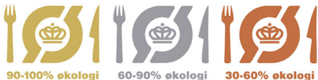
Figur 1. Det økologiske spisemærke

Et redskab i omstillingen af storkøkkenerne til økologi er det såkaldte "økologiske spisemærke". Udformningen af de økologiske spisemærker er illustreret i figur 1.