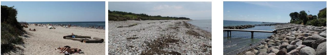
Fig.1 Billeder af forskellige typer kyststrækninger på Sjællandsnordkysten

Nedenfor ses 3 forskellige typer strande typiske for nordkysten på Sjælland. Billedet til venstre viser en sandstrand, billedet i midten viser en stenstrand og billedet til højre viser en kyststrækning uden strand. I denne analyse blev strande som ligner billedet til venstre defineret som sandstrande.