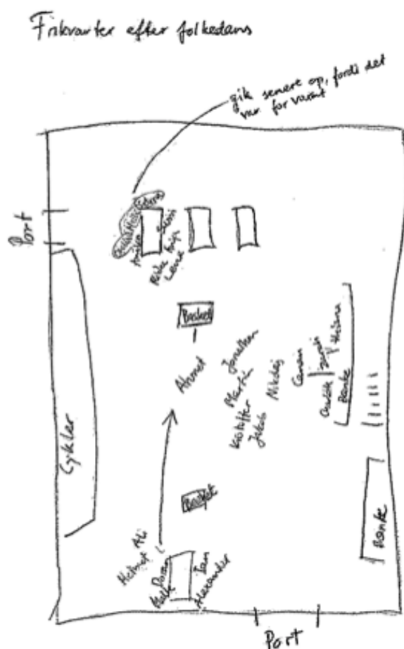
Figur 1. Skitse fra Quist 2005

Denne form for overblik over individer og grupper kan også foretages på andre måder. En almindeligt anvendt metode er at skrive feltnoter i prosaform, hvor man altså nedskriver sine observationer på stedet, stort set mens de sker. Følgende uddrag er fra mine egne feltnoter fra et studie af 9. klasserne på en folkeskole i København (Mægaard 2007):