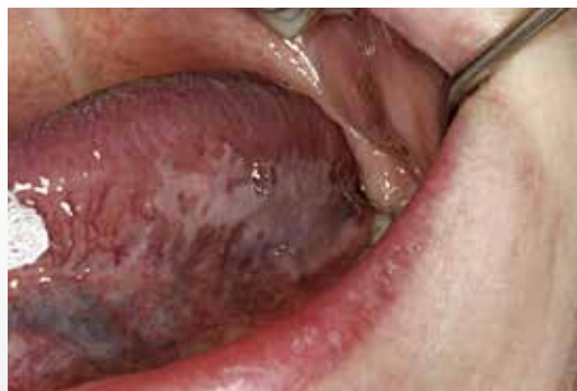
Fig. 2. Homogen leukoplaki posterioert på tungens underside hos 36-årig dansk kvinde.

Fig. 2. Homogenous leukoplakia of the posterior and ventral part of the tongue in 36 years old Danish woman.